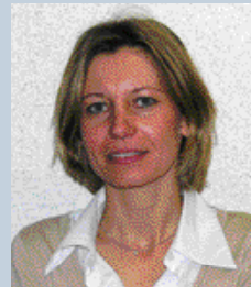
Greet GEYPEN Mechelen