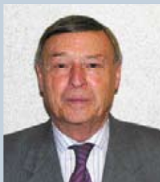
Leo GUNS Affligem