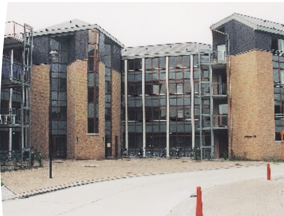
Delaplacestraat in Sint-Kruis-Brugge: wonen op mensenmaat

In 1998 hadden drie ontmoetingen met de pers plaats. In januari werden het nieuwe netwerk van SKV's voorgesteld, de effectiseringstechniek toegelicht en de leningsvoorwaarden overlopen. Het jaarverslag werd voorgesteld in mei en aan het eind van het jaar werden de resultaten van het kernenbeleidprogramma voorgesteld. De media stelden het daarbij aansluitende bezoek aan een kleinschalig, inbreidingsgericht huisvestingsproject bijzonder op prijs.